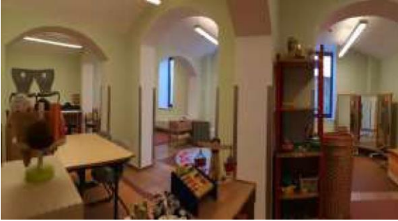
غرفة قوس قزح