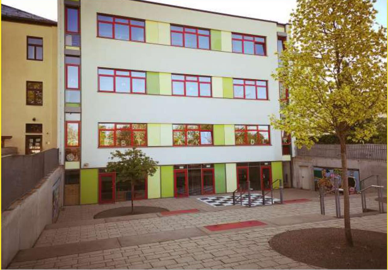
مركز الرعاية بعد المدرسة 41. Grundschule "إيلبتال كيندر"